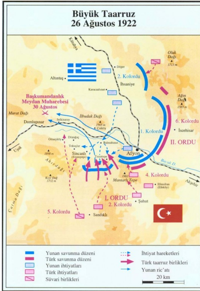
Şekil 2: 'Büyük Taarruz' ve 30 Ağustos Meydan Muharebesi

Büyük Taarruz, gerek planlaması gerekse uygulaması itibariyle harp prensiplerinin en ideal birleşimde, kesin sonucu en kısa zamanda, en az kayıpla alınmasına imkan verecek şekilde uygulanmasının tarihi bir örneği, Atatürk’ün askeri dehasının yansımasıdır. (Şekil 2)