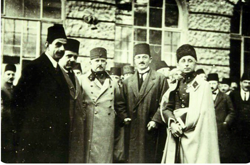
Şekil 5: Terakkiperver Cumhuriyet Fırkası, 17 Kasım 1924 Adnan Adıvar, Ali Fuat, Kazım Karabekir, Rauf Orbay, Refet Bele

Bugün, Anayasamızda ifadesini bulan laik, demokratik, sosyal, hukuk devleti ve 'Türk' nitelikleriyle Cumhuriyetimize sahip çıkmak için Atatürk'ü ve Türk devrimini bir bütün olarak anlamak, kavramak, hayata geçirmek ihtiyacı ve görevi her zamankinden çok daha büyüktür.